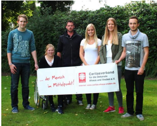
Unsere Auszubildenden 2015/2016

Sie wollen eine Ausbildung beim Caritasverband für die Dekanate Ahaus und Vreden e. V. absolvieren? Dann bewerben Sie sich! Bevorzugt per Email.