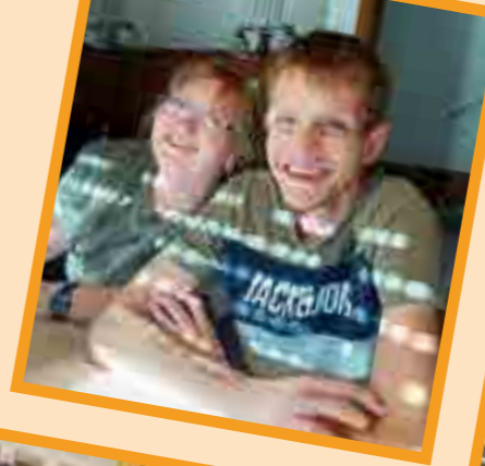
Impressionen aus dem FUD