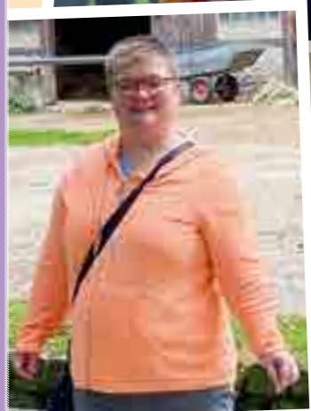
Impressionen aus dem ABW