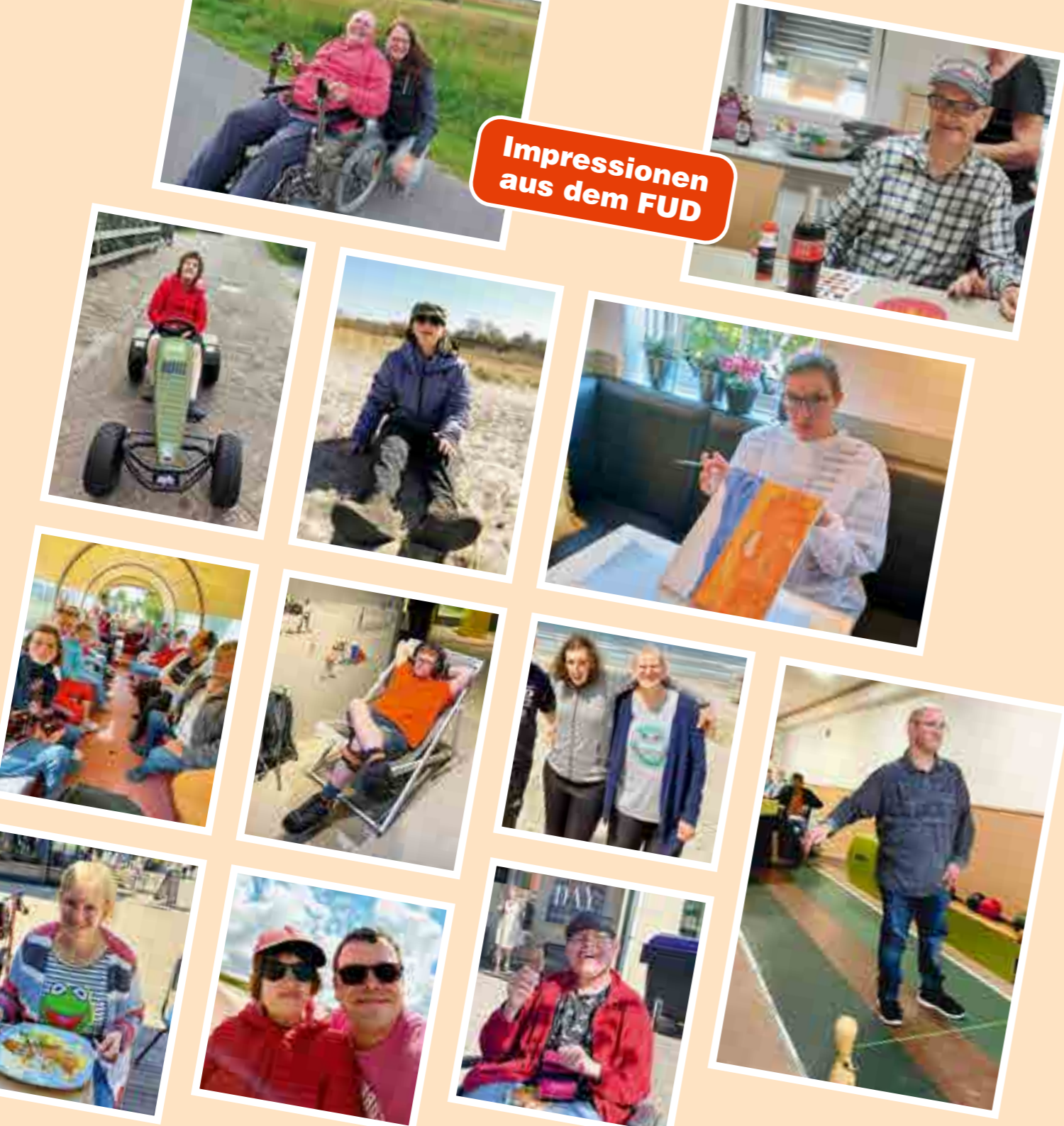
Impressionen aus dem FUD