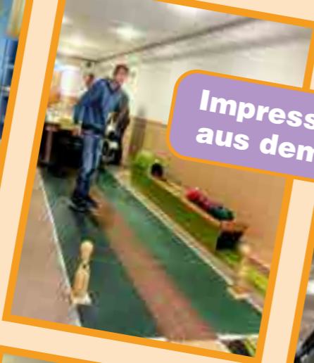
Impressionen aus dem FUD